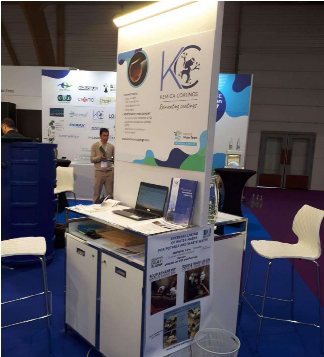
Carrefour des gestions locales de l'eau, 29 janvier 2020