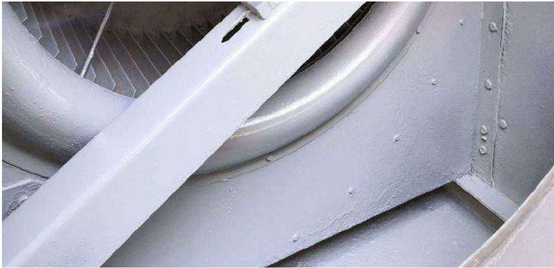
Revêtement de caisson de ventilation, SILTHEK