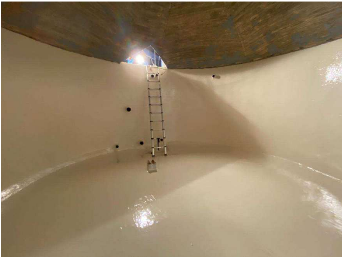
Etanchéité d'un réservoir d'eau potable en SOUPLETHANE WP