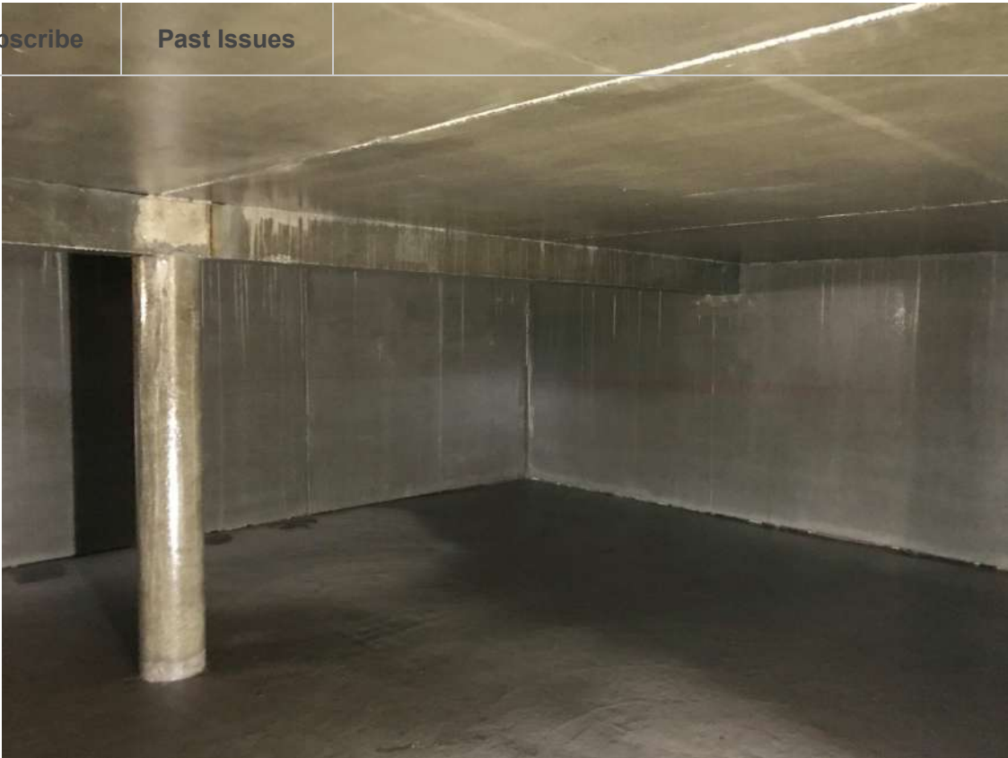
Sol, mur et plafond, Souplethane 5, PU Aqueux, Aix-les-Bains (73)