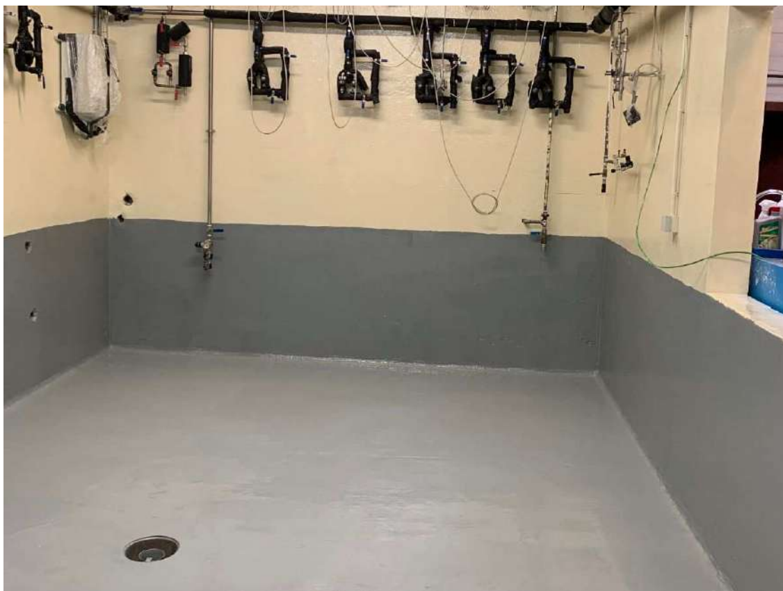
Mur et sol, Souplethane 5/6 Putty, Vendevre (14)