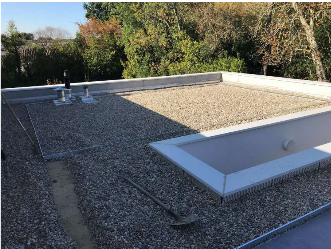
Toiture végétalisée, Bordeaux (33)