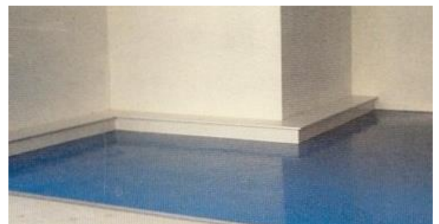
Lycée FEUCHEROLLES (77) sols de restaurant et de hall d'entrée traités en 1992 toujours en service – sans réfection